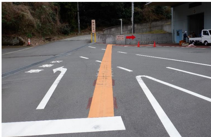
▲荷下ろし場所への進路を示すオレンジ線